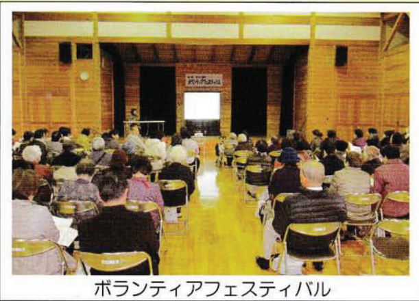
ボランティアフェスティバル