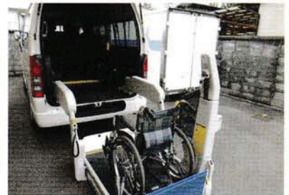
外出支援サービス