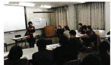
食育バイザーによる健康講座