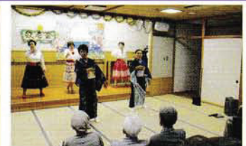
デイサービス事業