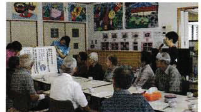
ミニデイサービス