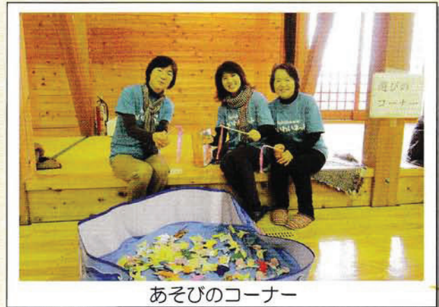
あそびのコーナー