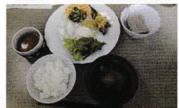
栄養豊富な試食メニュー