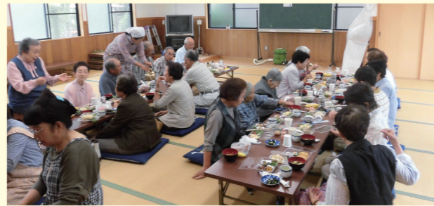
○災害ボランティアセンター運営協力員の養成 (災害ボランティアセンター立ち上げ訓練の実施)