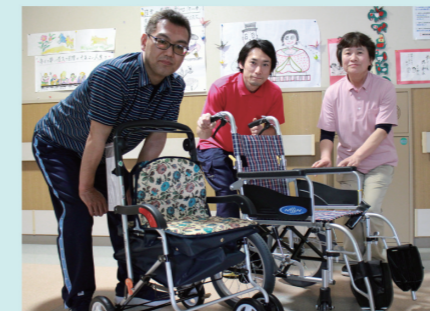
贈呈いただいた車イス

故有泉勝廣様のご遺族より社協へご寄付をいただき、車いすと押車を購入させていただきました。有泉様とご遺族様のご厚意に感謝を申し上げますとともに、故人のご冥福を心よりお祈り申し上げます。