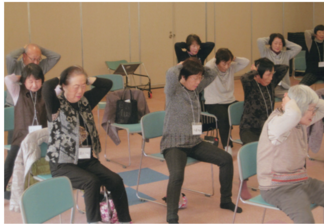
六郷いきいきサロン・健康体操