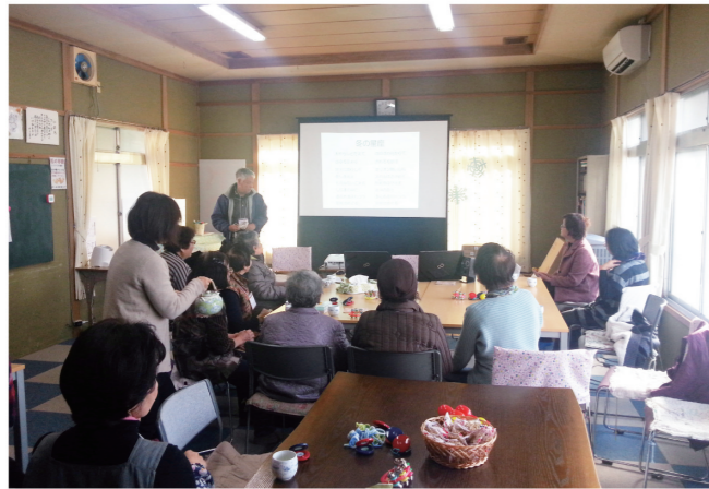
ほっこりカフェみさと・お茶会

昨年度は、ほっこりカフェみさと（誰でも気軽に来られるサロン）、六郷いきいきサロン（六郷地区初の月1回のサロン）の2カ所のサロンが開設されました。現在、町内には22カ所のサロンがあり、年々登録数は増えています。今後も地域の方々と一緒にサロン活動を推進します。