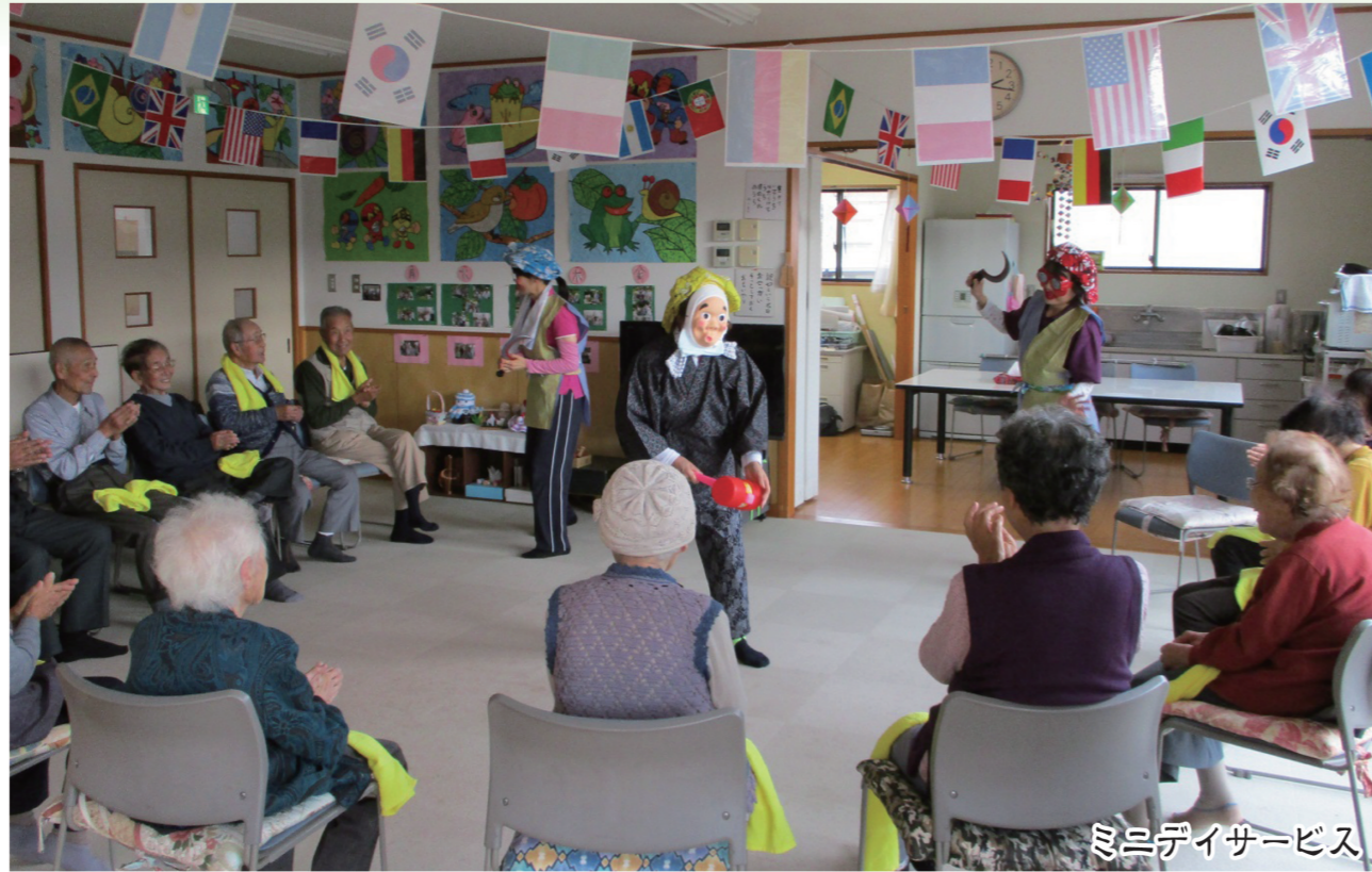
ミニデイサービス