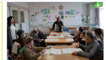
デイサービス事業