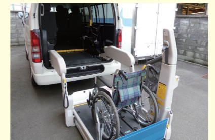
外出支援サービス