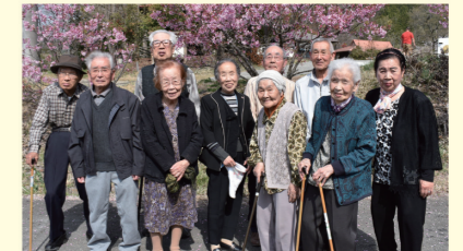
ミニデイサービス